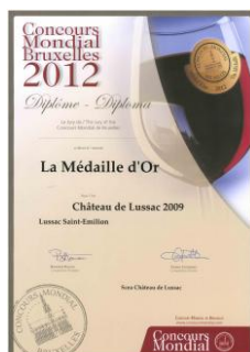
Médaille d'or Concours Mondial Bruxelles 2012